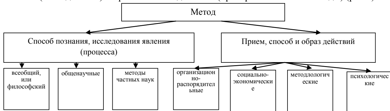
Рисунок 1 – Группы научных методов

Из определения метода вытекает, что существуют две большие группы методов: познания (исследования) и практического действия (преобразовательные методы) (рис.2).